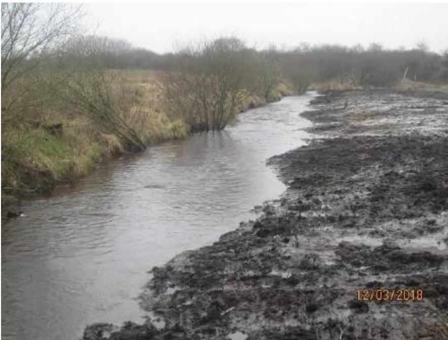
Stryg anlagt. Set i medstrøms retning langs dambrugsarealet.