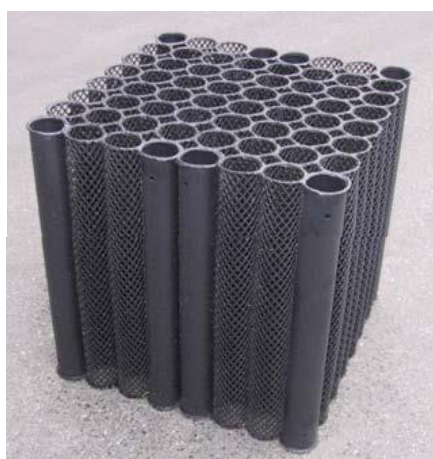
BIO-BLOK® 80 HD GF fra EXPO-NET