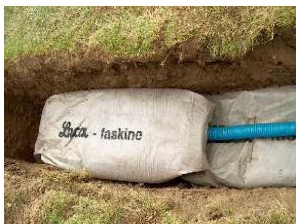
LECA® - faskineposer med letklinker fra Dansk Leca A/S