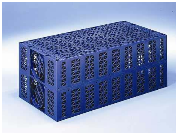
Regnvandskassette fra Wavin