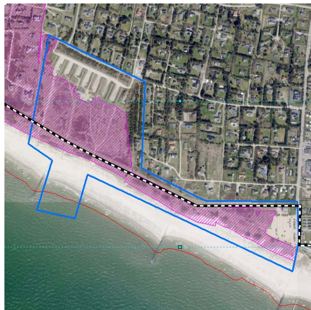
Figur 1 Projektområdet med §3 beskyttede områder og Oksbydige markeret

Med ideoplægget skabes der flere aktiviteter og en større rekreativ anvendelse af klit- og hedearealerne umiddelbart bag ved stranden. Der tilføres ligeledes en række funktioner, som skal bidrage til at gøre kystområdet ved Blåvand mere attraktivt. Hotellet på Hafniagrunden vil give flere besøgende muligheder for at opleve og nyde naturen ved Blåvand Strand med udsigt til havet og det rekreative område. Det blå plateau med et gårdrum, som giver læ, vil være velegnet til strandaktiviteter, når vinden er hård eller vejret er mindre godt. En boardwalk, der strækker sig igennem området fra Hvidbjerg Strand til Blåvand Strand, vil give flere mulighed for at opleve landskabet og den unikke natur ved kysten. Boardwalken er uden trapper og skarpe hældninger, så også gangbesværede har mulighed for at bevæge sig i klitterne. Legeaktiviteter i klitterne og langs strandkanten skal gøre det mere attraktivt for børnefamilier, at komme og nyde stranden, også når det ikke er perfekt badevejr.